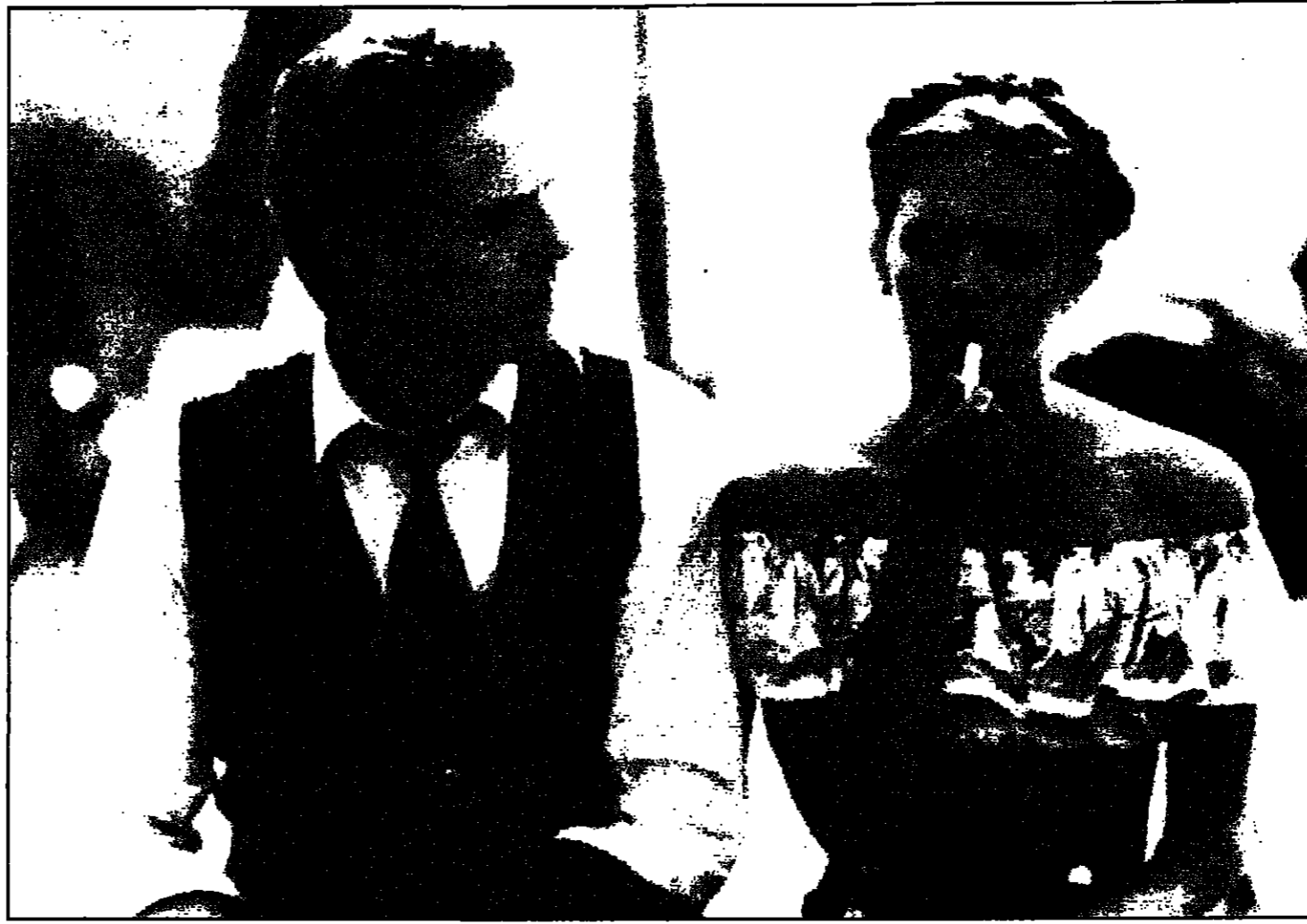
دومتيك سوين وجريسي ابرون في لقطة من الفيلم

اختار المخرج أديان لين في تناول رواية لويتا من أجلها على القرض من ذلك الذي اختاره المخرج ستانلي كوبريك قبل ثلاثين عاما في أول معالجة سينمائية لرواية فلايمير تابوكوف (سبع بطولات الفيلم آنذاك جيمس ماسون) ومن هنا نرى كيف جعل كوبريك، وفيلمه الذي خلقه بسبب تناوله البراد، والفرغ الحلاقة محور الرواية من مضمونها الوجداني، محافظا على مسافة بين المخرج والبطول، والابتعاد الجمالية بالمنصاع البريختي، حتى يحول دون توحيد المخرج، بشخصية البطل ويجعل الأول على تأمل سحنة الثنائي عذائيا لا وجدانيا، ويوسع كل من يقرأ رواية تابوكوف، ان يراه ان تنازل هذا محكوم عليه بالقطب سيقا، لان جوهر الرواية يتصور حول تلك العاطفة الاستوائية، والشيق للهوس الذي يسيطر على البطل ميمرت الأستاذ الجامعي الذي تجاوز منتصف العمر، منذ اللحظة التي تقع عيناه فيها على الراقصة طوليطة ابنة الثانية عشرة وبعد ان يجنح في اغواء لويتا ويندم مذاق الفاكهة المحرمة، يضيء بها في رحلة للكشف عن فنون المدارس الجنسية، ويتركها في سوريا من قبل لهما اكتشافه من لثق الشرقية، موضوع كيدا يستحيل تناوله بمزج من استكشاف تيارات العلة الوجدانية السارية بين الاثنين، وتحويلها الى ملامحة جسدية او مباشرة، اي انه بعد ان الرغ العلة من مضمونها العاطفي، فحاشي بأكبر قدر ممكن تقديم ملامحها الجنسية، فلم يتبق له الكثير كي يصوغ فيلمه كصور مرئية مؤثرة حسيا او جماليا.